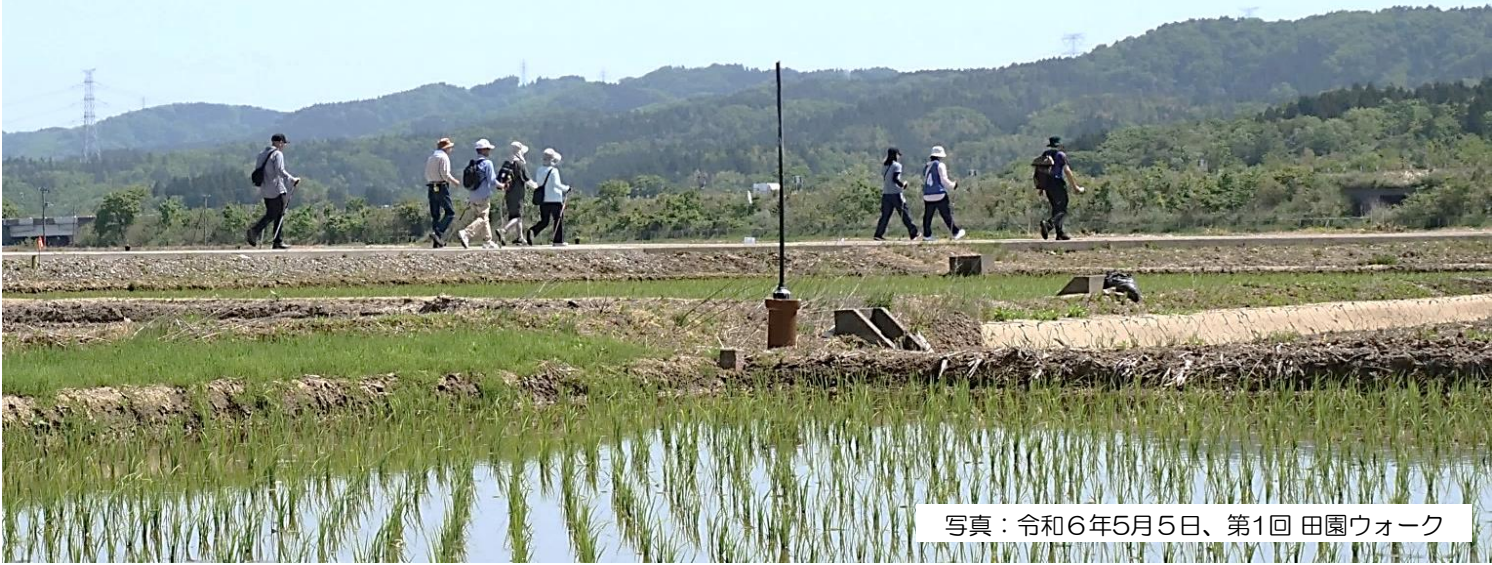
写真：令和6年5月5日、第1回 田園ウォーク