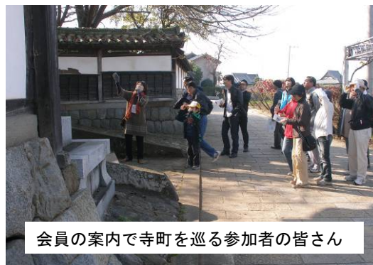
会員の案内で寺町を巡る参加者の皆さん

ゴールの万福寺境内では、朝市会の女性たちが丹精こめた熱々のほうとうに参加者は舌鼓を打ちました。もちろんワインと葡萄のサービス付です。山門前には朝市出店者の皆さんが手作りクッキーやジャム、工芸品などのお店を出し、催しに彩りを添えてくれました。