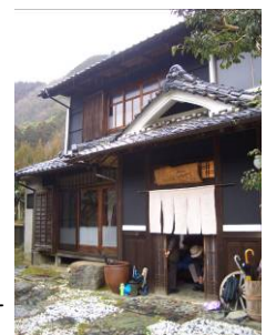
奥明日香のさらら

*古道を歩くフットパス では、地域の博物館や併 設のレストラン、郷土館、 公民館、農産物作業場、 お寺や神社などをフット パスオアシスとして活かす のもいいでしょう。