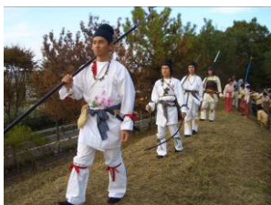
万葉時代防人の道ウォーク（防人祭り*）の風景

誰にでも分かり易い歴史観があってこそ地 域フットパスは味わいが深まります。郷土 史・地域史をヒントに、知識ではなく感性で 体感できる方式の歴史解説やウォーキング、 大小イベントが行われることでリピーターや ファンが増えていくに違いありません。古道 を歩く人や高台からかつての歴史景観を想像 し眺めている時の人の目はどこか遠くを懐か しんでいるかのように細くなり、幸せそうな 表情になるから不思議。次第に右脳の感性分 野が開き、内なるDNAの中に秘められた壮 大な記憶がよみがえり、知らず知らずのうち に心身が健康になっていく効果もあるのでは ないでしょうか。