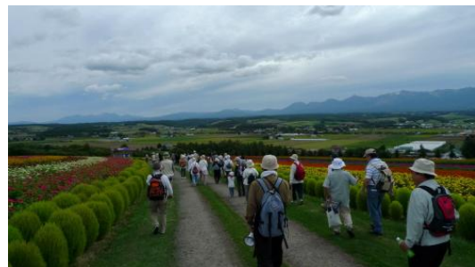
和田草原とどんぐりの郷パス

フットパスをする事により多くの事を学びます。道の繋がりは人との繋がりでもあります。今、私達愛好会は170kmくらいを歩くロングトレイルを計画中です。富良野地方へお越しの際は、かみふらのフットパスを味わってみてください。日本フットパス協会のご隆盛を心からお祈り申し上げます。