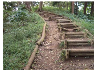
階段は不要！(明らかに歩行者は階段を避けて安全な左側の道のみを使っています。本来は左端の斜面のように、草が生えている場所が最も安全であるように、歩行エリアを区切る場合でも、ある程度自然に任せて草や枝葉があるくらいの方が人間の歩道としては安全、かつ心身にも優しいはずなのです。)

これからは遊歩道にはお金をかけない分、案内板やマナー板を増やした方が得策なはずです。「むかし式道普請」に学び、温もりのある「道」についてももう一度考えてみることもフットパスには大変必要なことではないでしょうか。